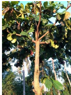
Gambar 1. Tumbuhan Terminalia catappa

Salah satu tumbuhan yang banyak ditemukan di kawasan pesisir tropis adalah ketapang ( Terminalia catappa ). Tumbuhan ini memiliki kemampuan adaptasi yang baik terhadap kondisi lingkungan yang kurang menguntungkan, seperti kadar garam yang tinggi dan ketersediaan air yang terbatas (FAJRIA, 2024). Secara morfologis, ketapang memiliki tajuk yang lebar dan sistem perakaran yang kuat, sehingga mampu bertahan terhadap tekanan angin serta membantu menjaga kestabilan tanah di wilayah pantai (Marlianingrum et al., 2021)