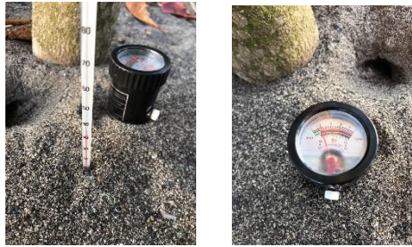
Gambar 3. Pengukuran Suhu, pH, dan Kelembapan Tanah