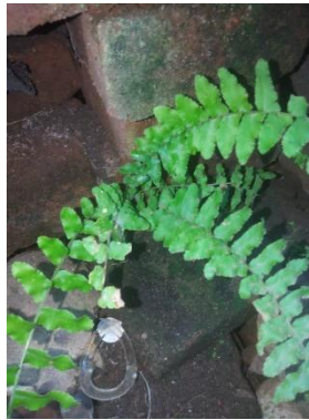
Gambar 1. Habitat Nephrolepis biserrata pada tembok lembap di Kelurahan Turida

Berdasarkan hasil observasi di Kelurahan Turida, Kecamatan Sandubaya, Kota Mataram, Nephrolepis biserrata ditemukan tumbuh pada tembok yang lembap dan teduh. Habitat tersebut menunjukkan bahwa tumbuhan paku memiliki kemampuan beradaptasi pada substrat selain tanah selama kebutuhan kelembapan tetap terpenuhi (Widjaja, 2021).