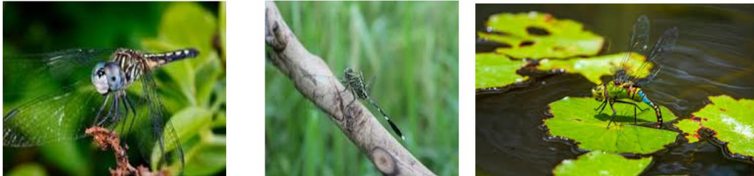
Gambar 3. Capung ( Orthetrum sabina ) sebagai bioindikator pencemaran lingkungan

Hasil tinjauan literatur menegaskan bahwa pemantauan kualitas udara secara biologis menggunakan O. sabina menawarkan efisiensi yang lebih baik dibandingkan instrumen mekanis dalam hal cakupan area. Karena capung ini bersifat teritorial namun memiliki daya jelajah tertentu, mereka berfungsi sebagai "stasiun pemantau bergerak" yang mampu mengintegrasikan data kualitas udara di suatu wilayah secara real-time. Prasetyo dkk. (2020) menambahkan bahwa penggunaan bioindikator ini sangat ekonomis dan dapat diaplikasikan untuk pemetaan zona polusi udara di kota-kota besar di Indonesia tanpa memerlukan biaya operasional alat yang tinggi.