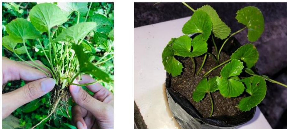
Gambar 3. Centella asiatica pada fase vegetatif tanpa bunga

Namun, jika ditinjau secara ekologis, reproduksi generatif pada pegagan bukanlah strategi yang dominan. Hal ini disebabkan oleh tingginya ketergantungan proses tersebut terhadap kondisi lingkungan, seperti intensitas cahaya, kelembapan, dan suhu, serta lamanya waktu yang dibutuhkan mulai dari pembungaan hingga perkecambahan. Kondisi ini menyebabkan tingkat keberhasilan reproduksi generatif menjadi relatif rendah dibandingkan metode lain yang lebih efisien.