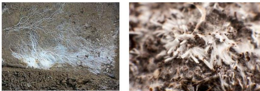
Gambar 1. Struktur miselium dan hifa jamur dalam menyerap zat pencemar di tanah

Namun beberapa jenis jamur seperti Aspergillus dan Penicilium memiliki tingkat toleransi yang tinggi terhadap kondisi lingkungan yang tercemar. Jamur-jamur ini mampu bertahan dengan cara mengakumulasi logam berat dalam selnya atau mengubah bentuk kimia zat pencemar menjadi kurang berbahaya. Hal ini didukung oleh penelitian yang menunjukkan bahwa jamur memiliki kemampuan biosorpsi terhadap logam berat, sehingga keberadaan spesies tertentu dapat menjadi indikator adanya pencemaran tanah (Alloway, 2013). Hal ini dapat dilihat pada Gambar 1 yang menunjukkan struktur hifa jamur dalam menyerap dan mengakumulasi zat pencemar di dalam tanah.